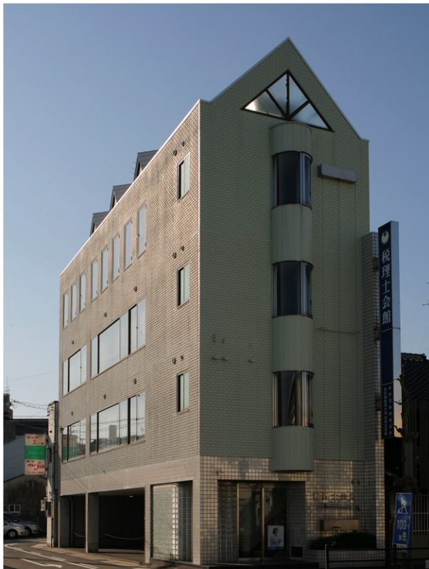
(写真: 岐阜北税理士会館)